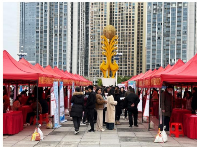
图 1：柳东新区 2025 年招聘会现场